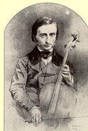
Offenbach als jonge cellist