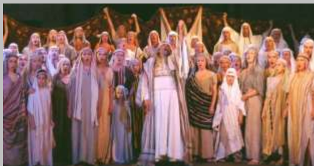
tutti sotto voce.....