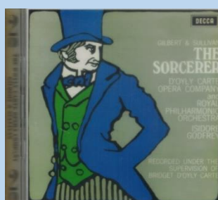
Decca Records 1966