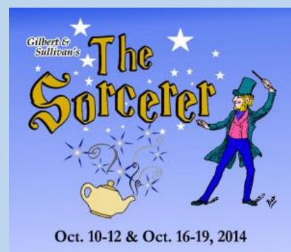
Pittsburgh U.S.A. 2014