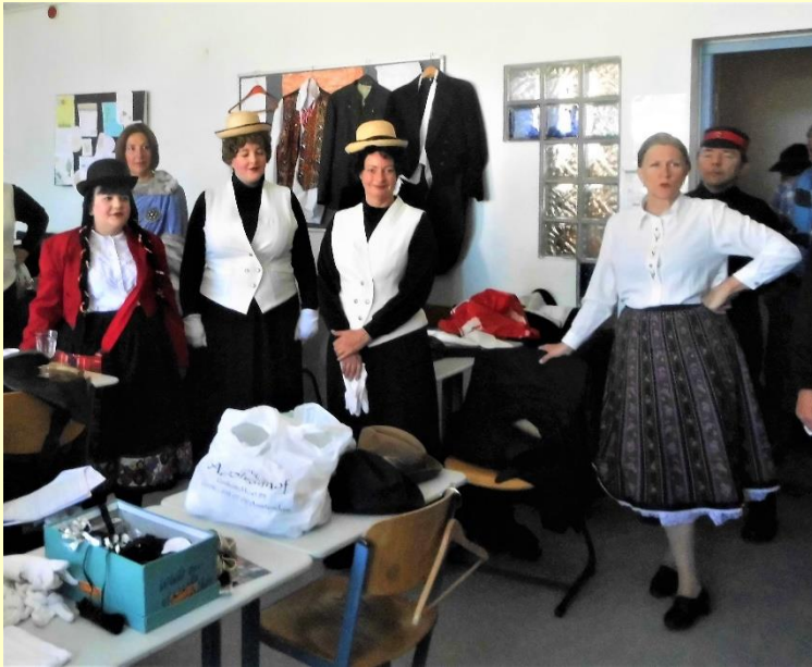
Vlak vóór aanvang, helemaal klaar.....

Ik zag een stukje van La Vie op YouTube, door een operagezelschap uit Toulouse. Die Fransen doen dat héél secuur... Het orkest uit de vijfde akte werd schitterend gespeeld, hoewel heel anders. Urbain zingt fermez les yeux – de obers antwoorden met fermons les yeux. Ja, die fijne nuance is moeilijk te vatten in vertaling, dus dat is privé is best aardig, al zingen ze dan tweemaal hetzelfde.